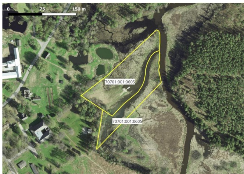
Joonis 1. Kavandatava tegevuse asukoht Ruusa külas

Kavandatava tegevuse eesmärgiks on Põlva maakonnas Räpina vallas Ruusa külas Puhkeniidu kinnistul 1 Võhandu jõe äärde kavandatud puhkeala rajamise esimese etapina Võhandu jõe endise harujõe puhastamine settest ca 3 900 m 3 ulatuses ning madala ja liigniiske ala maapinna tõstmine. Maapinna tõstmiseks on kavandatud kasutada harujõest väljakaevatavat setet.